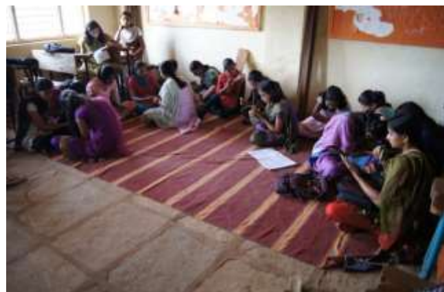
Rally, Rangoli and Mehendi Competition