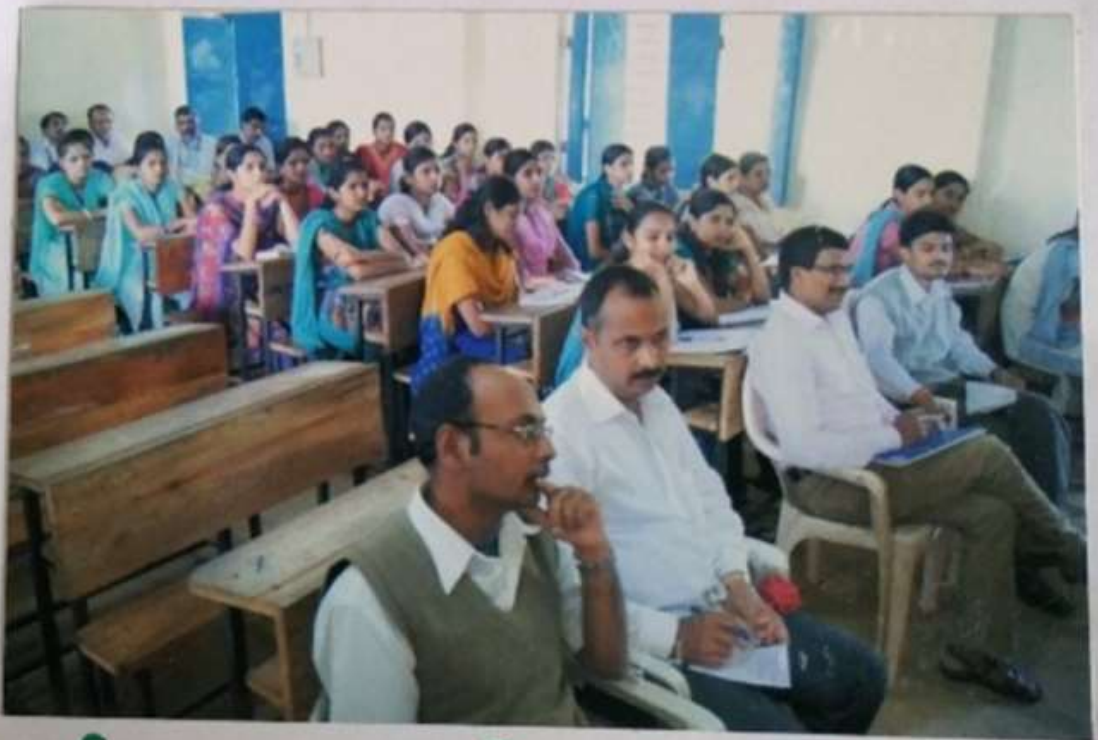
कार्यक्रमास उपस्थित विद्यार्थी व प्राध्यापक