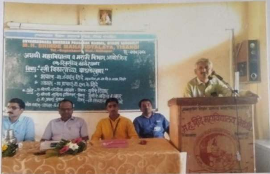
स्त्रीविकासाच्या पाऊलबुणा या विषयावर विद्यार्थ्यांच्या व्याख्यान करताना मा. लळेकर सर